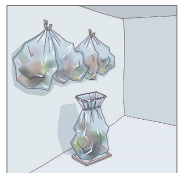
Sekkestativ eller oppheng på vegg